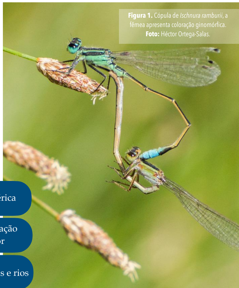
Figura 1. Cópula de Ischnura ramburii , a fêmea apresenta coloração ginomórfica.

A categoria de status de conservação de acordo com a IUCN é Preocupação menor. Sua distribuição é muito ampla. Suas populações são abundantes e aparentemente não são muito afetadas pela presença humana em seus habitats.