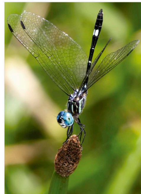
FIG. 142. Micrathyrus sympriona ♂. Esta posición llamada obelisco, es usada para evitar el sobrecalentamiento por radiación solar / This position is called obelisk, adapted to avoid overheating by solar radiation.