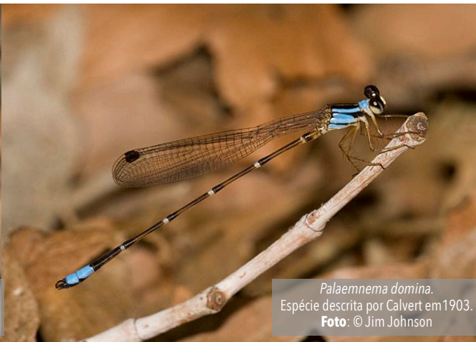
Palaemnema domina. Espécie descrita por Calvert em 1903.