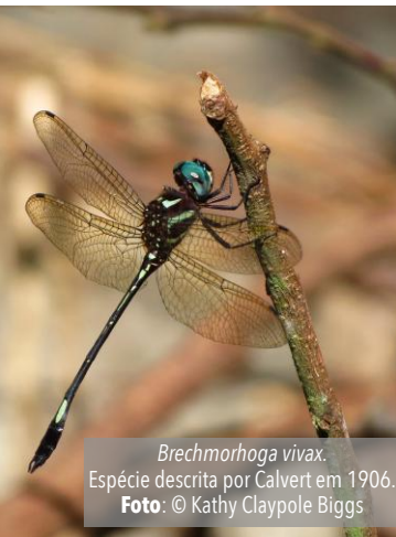
Brechmorhoga vivax. Espécie descrita por Calvert em 1906.

Pouco depois que ele deixou de ensinar, ele sofreu um derrame cerebral com perda de fala e paralisia parcial, da qual se recuperou quase completamente. Portanto, por vários anos, ele continuou indo para o departamento de insetos da Academia de Ciências Naturais. Finalmente, faleceu em 23 de agosto de 1961. Nas palavras de James AG Rehn (1962), "não apenas uma das maiores figuras da época foi perdida, alguém que não era apenas