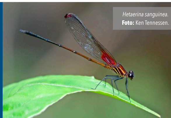
Hetaerina sanguinea .

ISBN: 978-1-77670-704-1 (edição eletrônica).