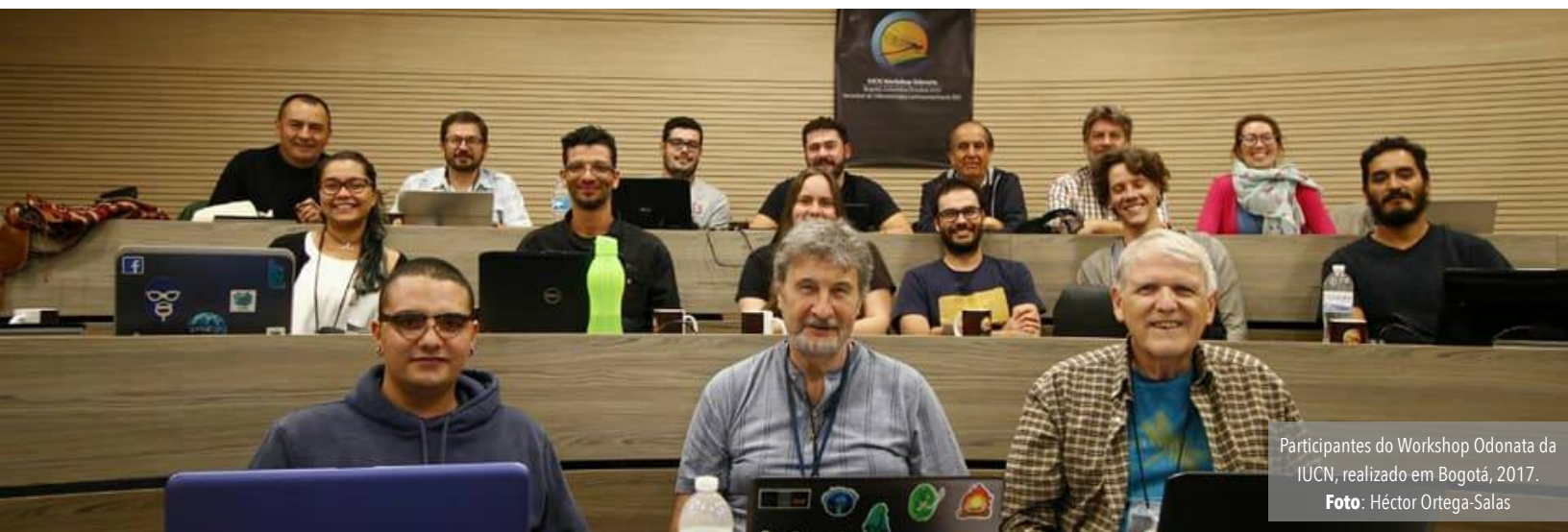
Participantes do Workshop Odonata da IUCN, realizado em Bogotá, 2017.

Para realizar este projeto, foi elaborada