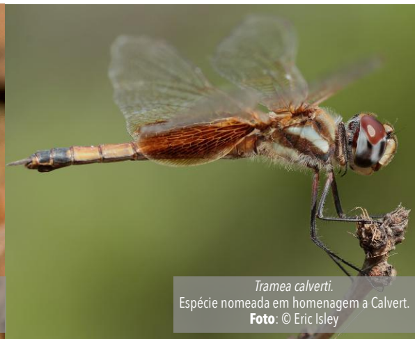
Tramea calverti. Espécie nomeada em homenagem a Calvert.